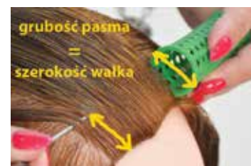
Dobór pasma włosów do wałka