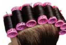
Nawijanie metodą płaską na wałki