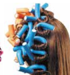
Nawijanie metodą płaską na papiloty