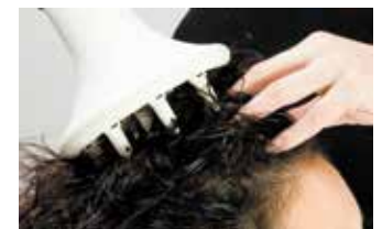
Podkręcanie loków dyfuzorem