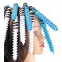
Nawijanie metodą spiralną na wałki spiralne